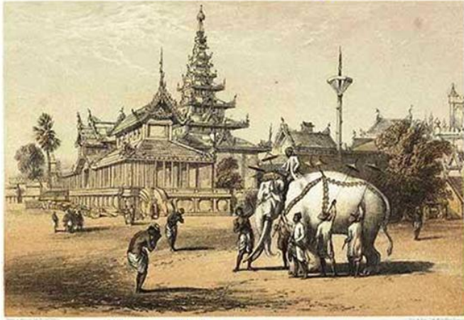
ជំរិសពាព្រះទីនឹងនៃព្រះរាជា - ប្រទេសកូម៉ា

ចំពោះសត្វជំរិស អ្នកផងគេនិយមហៅថា ជំរិស។ តាំងពីបុរាណកាលមក ជំរិសត្រូវគេចាត់ទុកជាសត្វមានតម្លៃទើបមហាក្សត្រនានាកាលសម័យដើមតែងចង់បានយកមកធ្វើជាយានជំនិះដំរូងរៀងរបស់ខ្លួន។