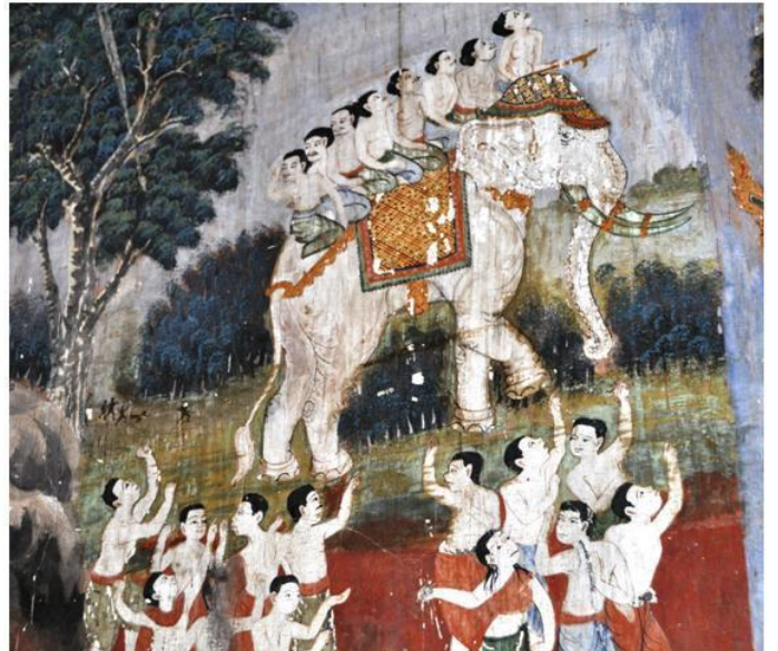
ជំរិសដែលព្រះវេស្សន្តរបានប្រទានឱ្យដល់អ្នកមកសួរមានព្រះអង្គ - វត្តកំពង់ត្រឡាចលើខេត្តកំពង់ឆ្នាំង

ព្រះវេស្សន្តរ ក៏មានជំរិសជាព្រះទីនឹង ដែលរាស្ត្រប្រជាជឿថាជាសត្វនាំមកនូវសិរិស្សស្តីដល់ព្រះនគរ លុះព្រះវេស្សន្តរធ្វើទានជំរិសនោះដល់រាស្ត្រនគរដទៃ នគររបស់ទ្រង់ក៏ជួបប្រទះភាពរាំងស្ងួតនិងទុរភិក្ស រហូតដល់រាស្ត្របះបោរ ទាមទារឱ្យនិរទេសព្រះវេស្សន្តរពេញពីព្រះបរមរាជវាំង។